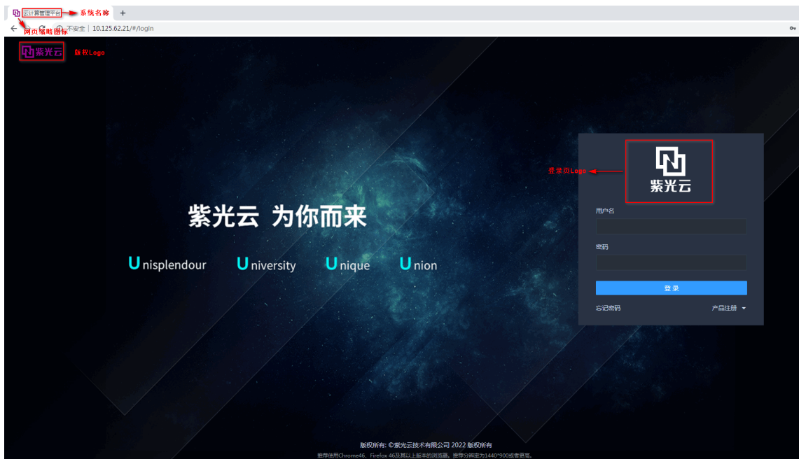
图4-2 客户化定制 UniCloud Usphere VMS 虚拟化管理平台登录界面

(3) 清空浏览器缓存，重新登录 UniCloud Usphere VMS 虚拟化管理平台，验证客户化定制结果。